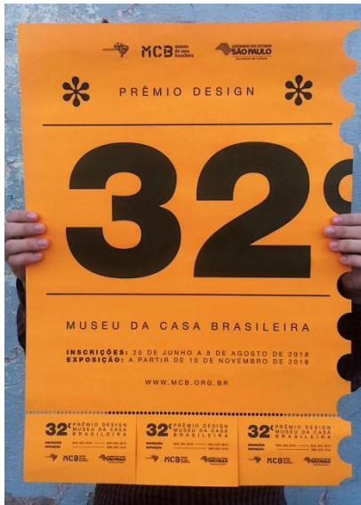
Autor: Leonardo Tavares | Londrina – PR Instituição de ensino: Unifil