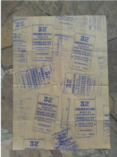
Autor: Caio Camarinha | São Paulo – SP