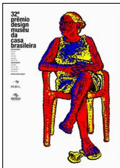
Cartaz vencedor - Autor: Celso Hartkopf Lopes Filho – Recife (PE)

O resultado completo pode ser conferido no site www.mcb.org.br