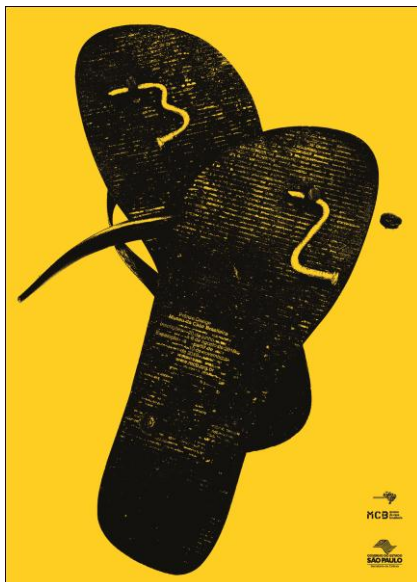
Autores: Maurício Firmino da Silva Junior e Marcelo José Tavares Silva | São Paulo - SP