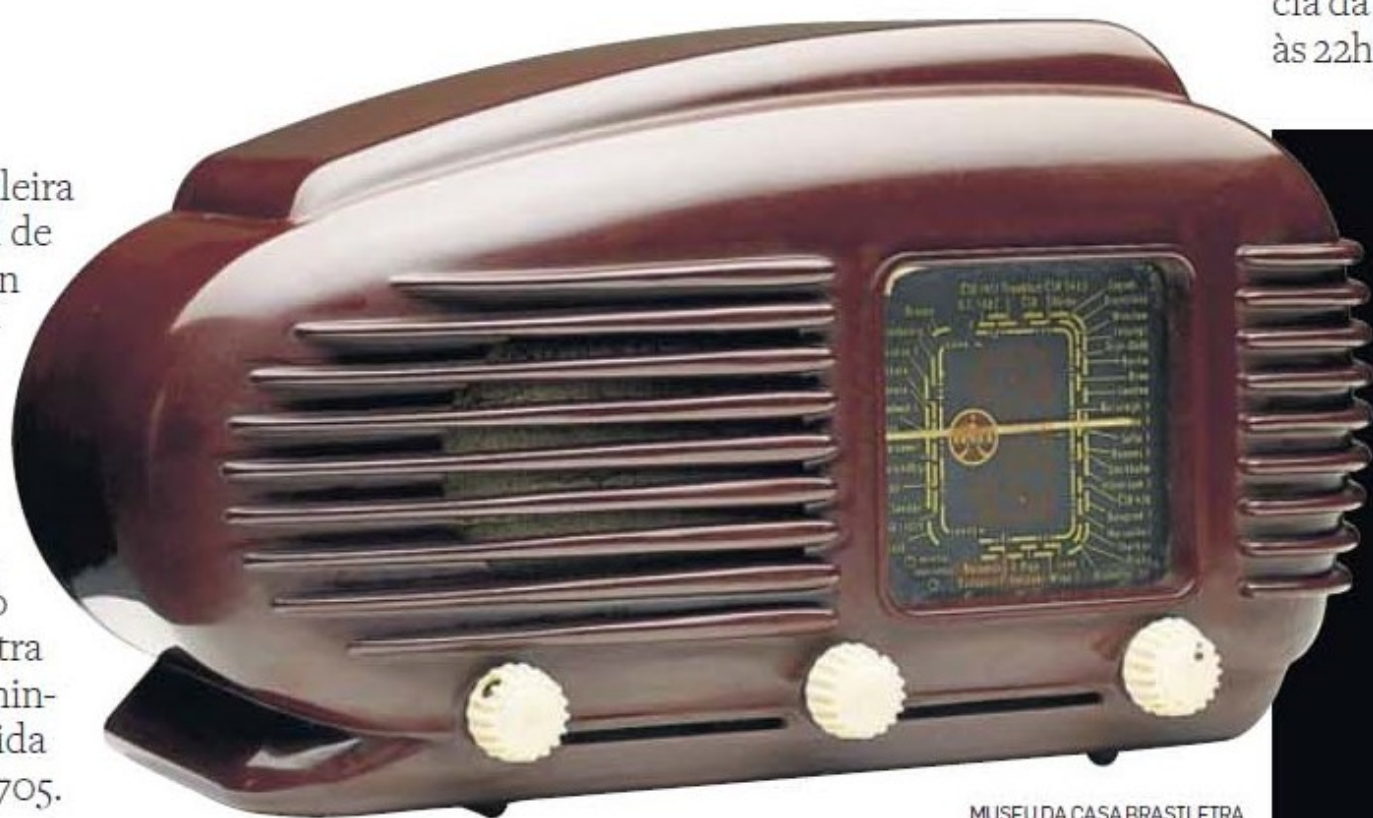
MUSEU DA CASA BRASILEIRA

O Museu da Casa Brasileira recebe, a partir do dia 21 de abril, a exposição "Design Aerodinâmico – Metáfora do futuro". Nela, é possível conferir mais de 250 objetos, de meios de transporte a utensílios domésticos, considerados ícones do estilo streamline. A mostra está aberta de terça a domingo, das 10 às 18h, na Avenida Brigadeiro Faria Lima, 2705.